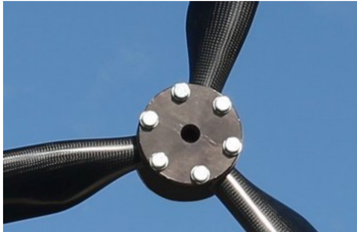
the anodized flange is mounted on the hub

Put the hub against the engine's flange and slightly torque the screws with their washers, before beginning the pitch adjustment.