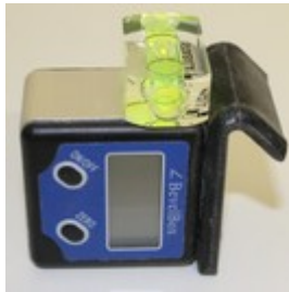
Digital protractor (precision : \pm 0,1^\circ ) with a bubble to keep the blade horizontal

E-Props provides with each propeller a digital protractor with a precision of \pm 0,1^\circ , easy to use, because the aircraft has not to be on a flat surface. The digital protractor is set to zero by supporting the opposite side of the hook against the flange of the propeller (vertically and between two screws).