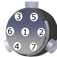
tightening sense of the screws

The torque must be gradually applied, in order to avoid a change of the pitch : 2 N.m, then 4, 8, 16, 20 N.m.