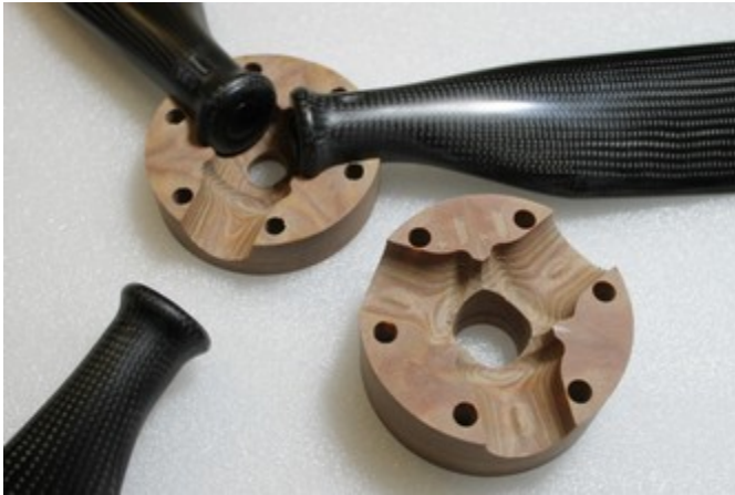
moyeu bois densifié et pales

Réunir les pales, les deux parties du moyeu, la contreplaque et la visserie.