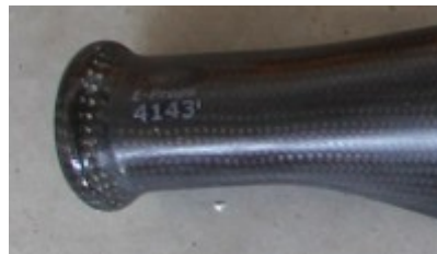
example : serial number on blade's foot

Each E-PROPS part has a serial number. Those numbers are integrated in resin and cannot be removed.