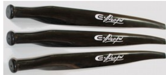
moyeu carbone et pales

Positionner les pieds de pale dans le demi-moyeu côté moteur. Les pales se positionnent dans les gorges prévues dans les moyeux.